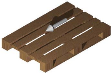
Längstransport/ hosszanti mozgatás